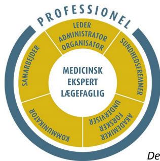
De 7 lægeroller

”et uddannelsesforløb for en læge, der ikke inden for det planlagte forløb er i stand til at opnå de kompetencer, som uddannelsesprogrammet angiver”.